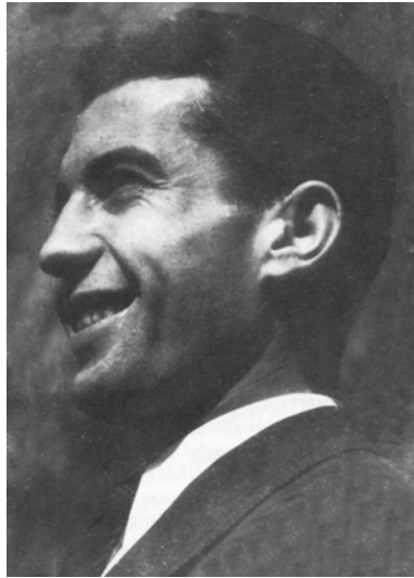
Figura 3.3: Ettore Pancini verso il 1945.

delle conclusioni dai raggi cosmici, dalle poche cose che noi riuscivamo a mettere insieme, che erano geniali.