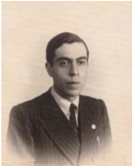
Ettore Majorana a Napoli nel 1938

Nella parodia del Faust di Goethe, messa in scena nell'aprile del 1932 a Copenaghen, in occasione del decimo anniversario dell'Istituto di Fisica Teorica diretto da Bohr, c'era una scena in cui si vedeva Slater uccidere un drago che rappresentava la simmetria dei gruppi: "La bestia coperta di indici è morta di antisimmetria". I disegni sono di G. Gamow.